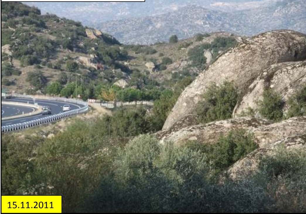
Zwischen Xanthos und Izmir