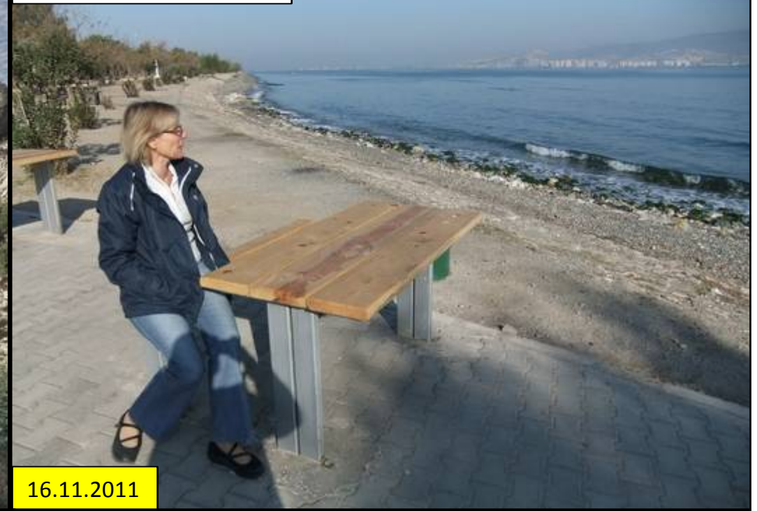
An der Bucht von Izmir