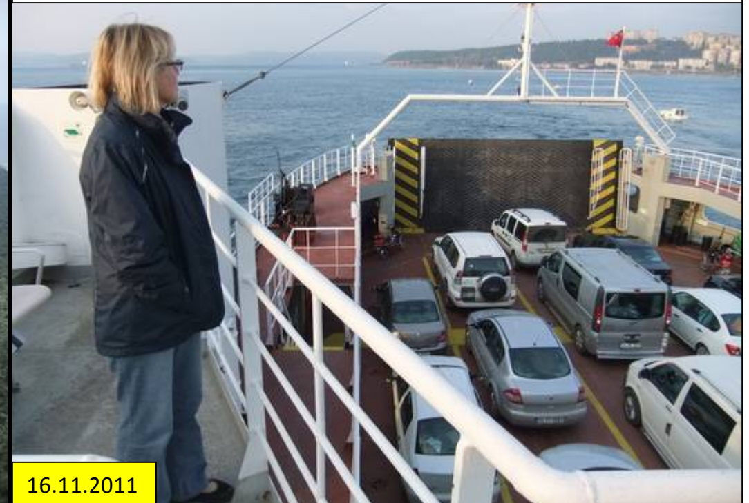
Auf der Faehre zwischen Cannekate (Asia) und Eceabat (Europe)