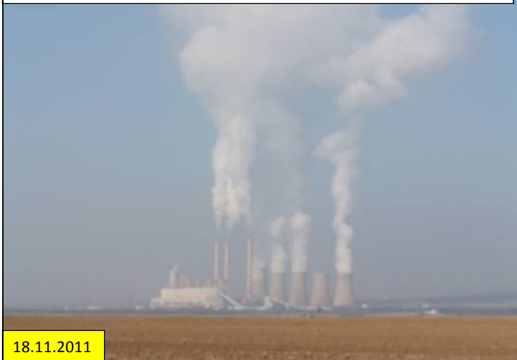
Thermisches Kraftwerk zwischen Thessalonik und Igoumenitsa