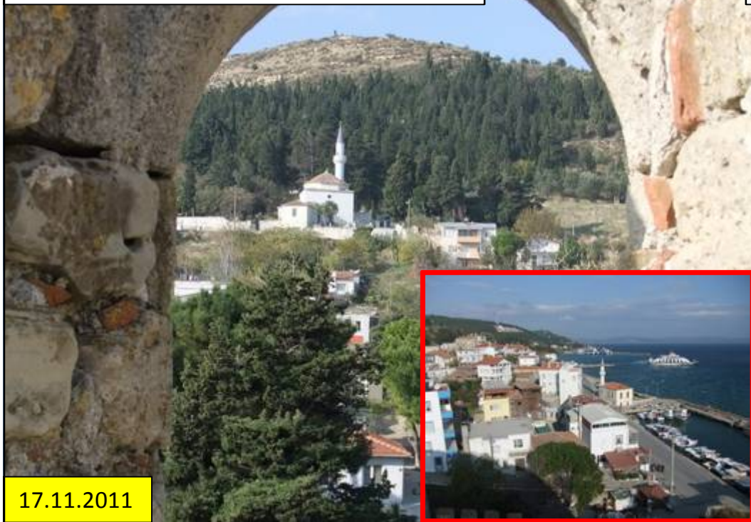
Aussichten von der Burg Nahe Eceabad