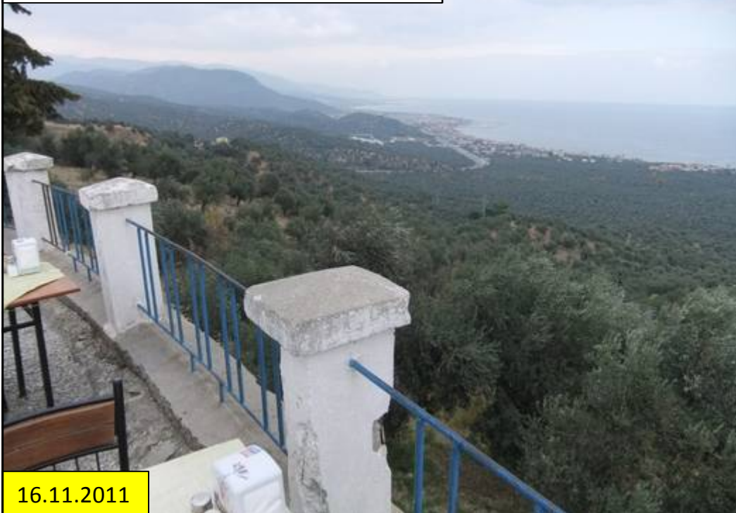
Zwischen Izmir und den Dardanellen