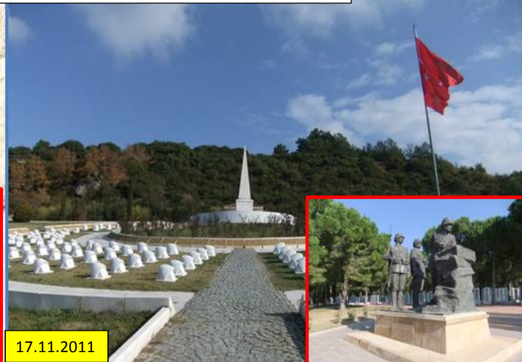
Dardanellen: Denkmaler vom 1. Weltkrieg